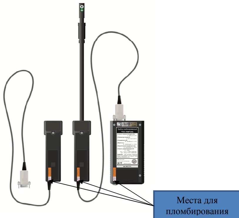
Рисунок 5 - Приборы комбинированные «ТКА-ПКМ» (на примере варианта исполнения 3), вид сзади