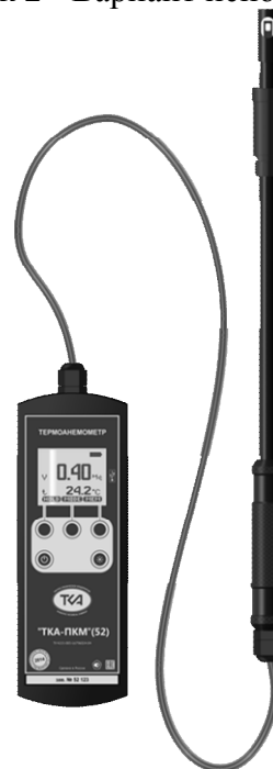
Рисунок 4 - Вариант исполнения 4